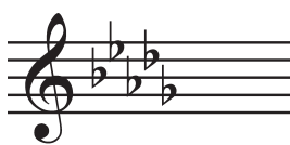
Ré bémol majeur